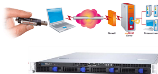
sayTRUST Access Appliance (modellabhängig)